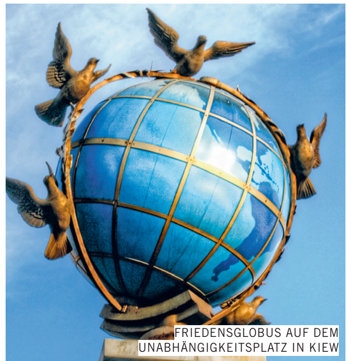
FRIEDENSGLOBUS AUF DEM UNABHÄNGIGKEITSPLATZ IN KIEW

Neben den Schwierigkeiten auf dem Weg zu einem Verhandlungsprozess sehen wir aber auch erste positive Schritte, ein