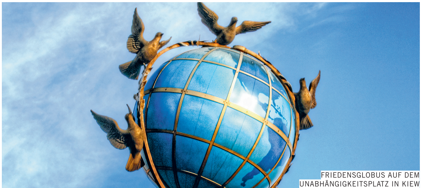
FRIEDENSGLOBUS AUF DEM UNABHÄNGIGKEITSPLATZ IN KIEW