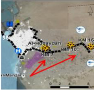
(CDSF) Intersections « Kilo 7, 10 et 16 » à l'est d'al-Hudaydah

Absence d'activité militaire dans et autour d'al-Hudaydah. Le 18 septembre, le porte-parole de la Coalition a annoncé le lancement d'une nouvelle phase de l'opération Victoire dorée et revendiqué le contrôle des « kilomètres 7, 10 et 16 » à l'est de la ville, en direction de Sanaa. Cette manœuvre visait à bloquer les axes logistiques houthis, puis à encercler al-Hudaydah. Cependant, depuis le 30 septembre, les forces loyalistes se sont retirées de ces localités. Le 6 octobre, en l'absence de forces loyalistes et d'activité militaire sur l'axe Sanaa – al-Hudaydah, le contrôle de ces carrefours semble de fait acquis par les Houthis. De plus, la rébellion poursuit ses actions de harcèlement sur les zones arrière de la Coalition, au niveau de Zabid, Hais et Tuhayta. L'élongation de la ligne de front entre al-Hudaydah et al-Khawkhah, à 115 km plus au sud, continue d'exposer les forces de la Coalition aux contre-attaques houthies.