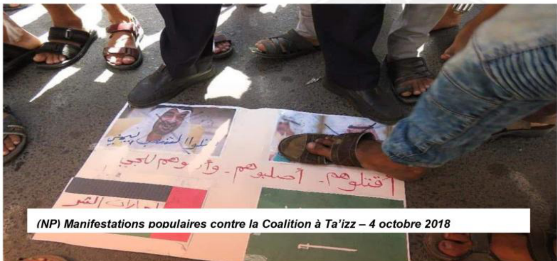
(NP) Manifestations populaires contre la Coalition à Ta'izz – 4 octobre 2018

À ce jour, si du matériel français est déployé au Yémen par la coalition arabe, aucun n'est engagé sur les fronts actifs.