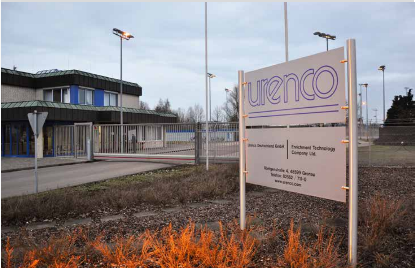
Urananreicherungsanlage der Firma Urenco in Gronau.

Die Gesellschaft für nukleare Verfahrenstechnik (GnV) war 1969 als Gemeinschaftsunternehmen von Dornier, ERNO, INTERATOM und M.A.N. Turbo gegründet worden. Später wurde die GnV neu strukturiert, Dornier und Erno schieden als Gesellschafter aus und Interatom und MT übernahmen die „GnV neu“ zu gleichen Teilen. Damit war die MAN über die GnV zusammen mit Interatom 23 einer der Hauptgesellschafter der CENTEC Gesellschaft für Zentrifugentechnik mbH, neben British Nuclear Fuels und Ultracentrifuge Nederland. Dies bedeutete eine gefährliche Allianz zwischen MAN und der British Nuclear Fuels (NLF), denn wie Atomwaffen A–Z schreibt 24 : „Seit 1950 trägt das Atomic Weapons Establishment (AWE) [in Großbritannien; Red.] die Verantwortung für alle Stadien von der Forschung und Entwicklung bis hin zur Demontage und Entsorgung der Atomwaffen. Diese werden in Aldermaston, Berkshire, entworfen und in Burghfield, wenige Kilometer östlich entfernt, gebaut. Das AWE ist ein »Joint Venture«