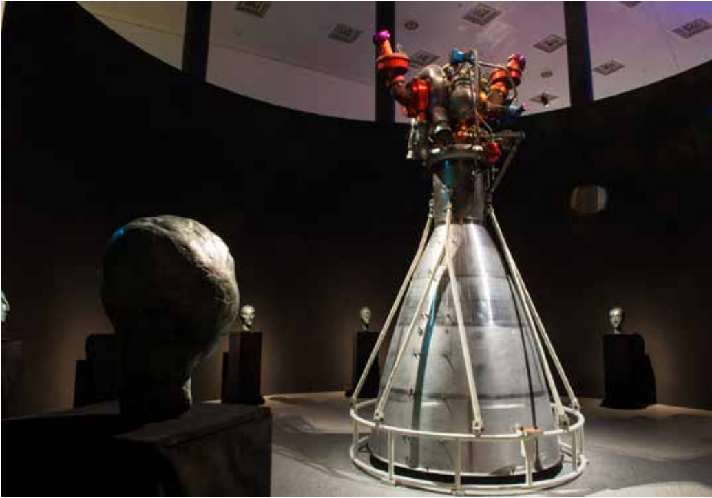
Haupttriebwerk einer Ariane 4, Viking.

für die Nazis die Raketenwaffe V2 zu entwickeln, dabei aber stets im Sinn gehabt hätten, der Menschheit den Weg ins All zu ebneten – was sie nach dem Krieg in den USA zielstrebig verwirklichten. Und die Konstrukteure um von Braun treffen keine Schuld daran, dass die SS zur Produktion dieser »Wunderwaffe« Konzentrationslager eingerichtet hatte und dass während dieser Produktion mehr Menschen umgebracht worden sind als durch die Angriffe mit der V2 auf London und Antwerpen. 29