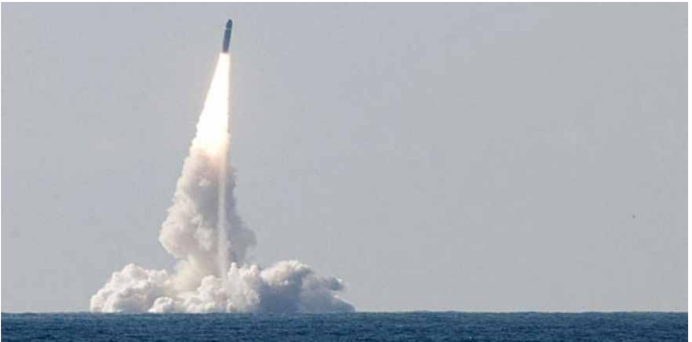
Die französische strategische Nuklearrakete M51 mit 54 t von ASL Airbus Safran Launchers bei einem U-Boot-gestützten Testflug im Atlantik

Aus all dem kann man folgern: wenn die Europäer vor allem mit der Ariane 6 mit SpaceX konkurrieren, so sind militärische Verwendungen inbegriffen, wie abschließend noch einmal genauer ausgeführt werden soll.