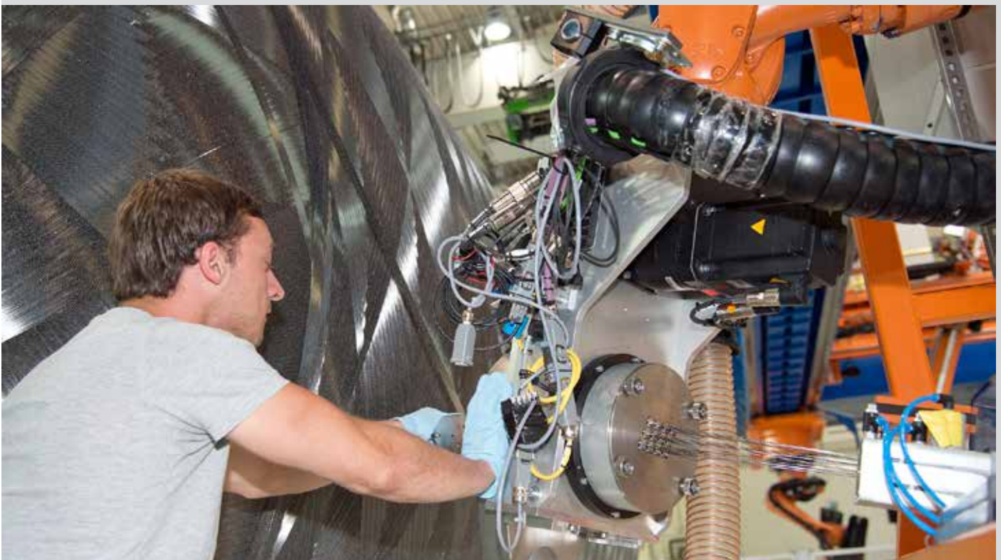
Das beim DLR Stuttgart und Augsburg in Kooperation mit MT Aerospace entwickelte und gefertigte Boostergehäuse.

Was hatten sie entwickelt? Eine Anreicherungs-zentrifuge, die leistungsfähiger und von wesentlich geringerem Energieverbrauch war als die us-amerikanische