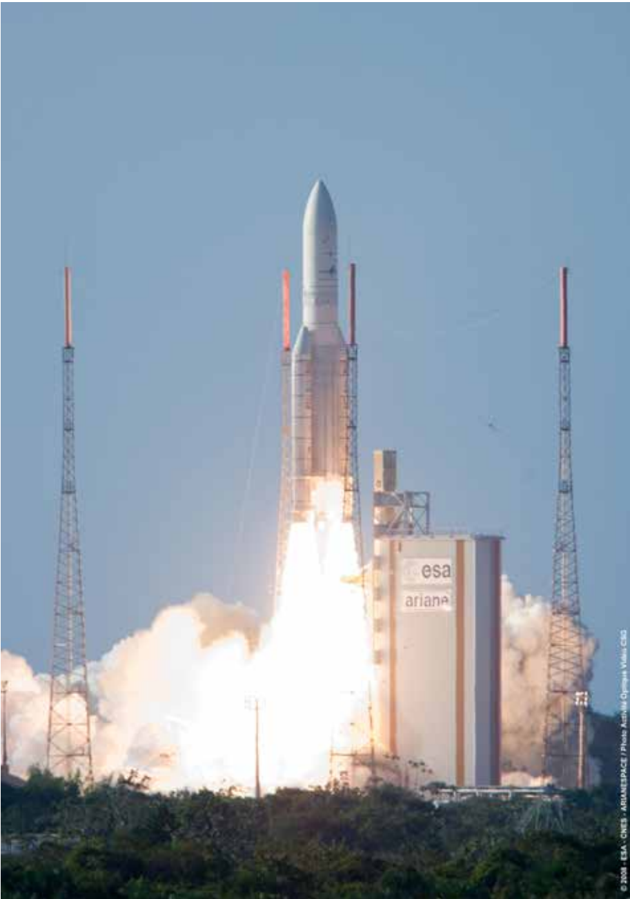
Start einer Ariane 5.

von Lockheed Martin, Serco Ltd. und British Nuclear Fuels Ltd. (BNFL), das einen 25jährigen Vertrag mit dem britischen Verteidigungsministerium abgeschlossen hat. Dieser Vertrag läuft 2025 aus.“