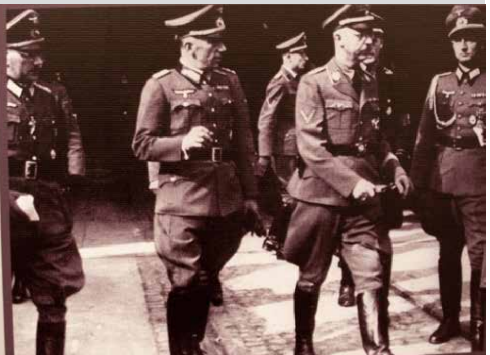
Ausstellung Zwangsarbeit für den „Endsieg“, KZ Mittelbau-Dora

General Dornberger (zweiter von links) zeigt SS-Chef Heinrich Himmler (Mitte) die Heeresanstalt Peenemünde, 28./29. Juni 1943. Rechts hinter Himmler vermutlich Wernher von Braun halb verdeckt, in der Uniform eines SS-Hauptsturmführers. (KZ-Gedenkstätte Mittelbau-Dora)