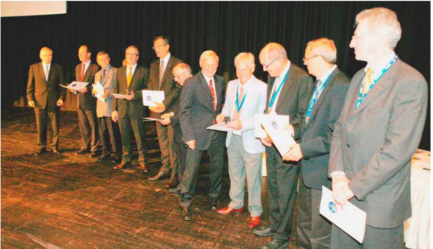
Verleihung des Wernher-von-Braun-Preises 2011 an das ATV-Entwicklungsteam der ESA.

zur Ausweitung ihrer Projektarbeit an. Schließlich bedeutete der Straßenname eine permanente Provokation für die Familie Pröll, deren Angehöriger im KZ Dora zu Tode gekommen war. 35