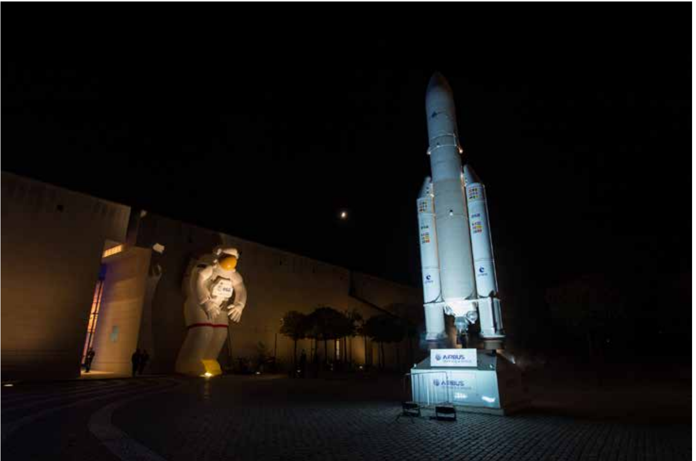
Modell einer Ariane-5-Rakete, das vor dem Eingang der Bundeskunsthalle steht.

Extra für deren Fertigung wurde eine 5400 m 2 große sowie 18 Meter hohe klimatisierte Produktionshalle gebaut und mit einem fast vollständig neuartigen Spezialmaschinenpark ausgerüstet. „Maschinenfabrik für das nächste Jahrhundert“ nannte der damalige bayrische Ministerpräsident Franz-Josef Strauß den riesigen Komplex, als er ihn am 30. September 1988 einweihte.